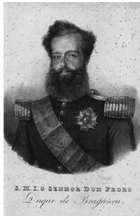
Dom Pedro I outorgou a Constituição de 1824, que lhe concedia amplos poderes

Logo após a vitória da Revolução de 1930, a Constituição de 1891 foi anulada. Getúlio Vargas, chefe do Governo Provisório, governou por meio de decretos-leis. Essa forma centralizadora de governar causou revolta entre os paulistas, que pegaram em armas para derrubar o presidente do poder.