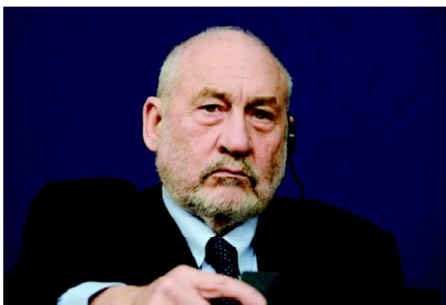
Joseph Stiglitz, vencedor do Nobel de Economia: taxa de juros inibem o crescimento econômico"

Para o prêmio Nobel, não se deve buscar meta de inflação com alta de juros. Ele afirmou que a inflação no mundo não vem da pressão da demanda, mas é diretamente influenciada pela pandemia e pela guerra da Ucrânia. Segundo ele, as taxas de juros crescentes em diferentes países do mundo pioram o proble-