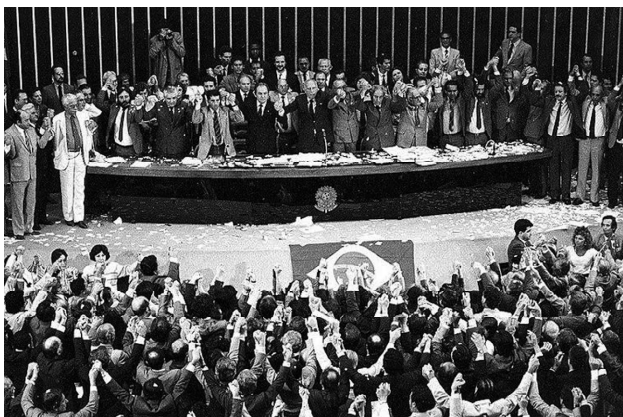
Sessão do Congresso Nacional que promulgou a Constituição de 1988, também conhecida como Constituição Cidadã

O dia 25 de março é lembrado em todo Brasil como o Dia da Constituição. É uma forma de recordar a data da outorga da primeira Constituição que vigorou aqui. Essa foi a Constituição de 1824, elaborada dois anos depois da independência, e que buscava aumentar o poder do imperador e garantir a unidade territorial.